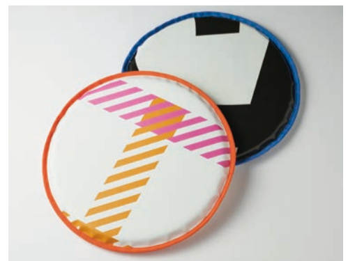
アウトドアアクション。生地を切り取る場所によってまったく違うデザインが生まれます。