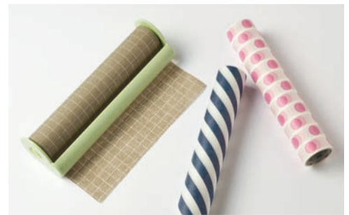
紙製なので直接「書ける」アイテムとしても使えるmtまもラップ。食事の際の汚れ防止にも。mtまもラップカッター箱入 / 税込 ¥2,530、mtまもラップカッター詰め替え用 200mm×7m / 税込 ¥880