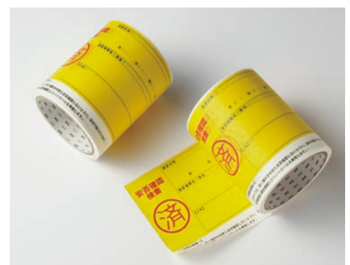
2022年に完成したテープ。ミシン目があってちぎりやすく、ノリづけていない部分があり、剥がしやすい。厚みがあってシワになりにくいのも特徴です。 倉敷テープ 115mm×15m (ラベルは1本に約100枚) / 税込 ¥2,530

ももとは工業用テープとして生まれたカモ井のマスキングテープ。長い歴史の中で培った粘着技術や紙質の選択などの知見・技術が詰まった倉敷テープは、災害時をはじめ、さまざまな場面で役立つアイテムとして今後も社会を支えていきます。