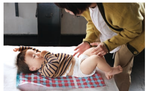
mt DRAPは屋外でのレジャーシートやペットのレインコートとしても使えます。お子さんの食べこぼし防止や、ヘアカット時のケープ代わりにも。 mt DRAP 550mm×10m / 税込 ¥913

「mtまもラップは全面がぴったりくっつくので子どもがずらしてしまうこともありません。使う方の状況を最大限に想像したものづくりをされていることにとても感動しました。私たちは今、育児手帳の開発を考えているのですが、手帳はマスキングテープとの相性もいいですし、カモ井さんといつか何かの形で一緒にできればと思います」