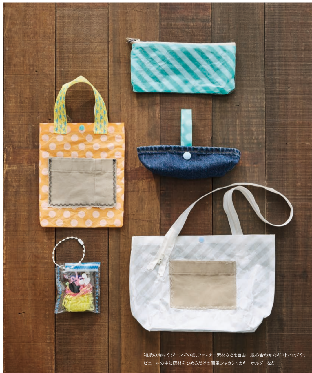
和紙の端材やジーンズの裾、ファスナー素材などを自由に組み合わせたギフトバッグや、ビニールの中に廃材をつめるだけの簡単シャカシャカキーホルダーなど。

れたら直して着る、自分のものを最後まで使い切るというサステナブルな意識については、近年さらに高まってきているように感じます。また他人とは違う、自分だけのオリジナルデザインのものを持ちたいというムードも、若い世代を中心に広がってきているようです。ものづくり館で開催するイベントにも、地域の方が興味や関心を持って来てくださり、ありがたい限りです。環境のことを視野に入れたものづくりの文化は、これからさらに発展していくのではないのでしょうか」