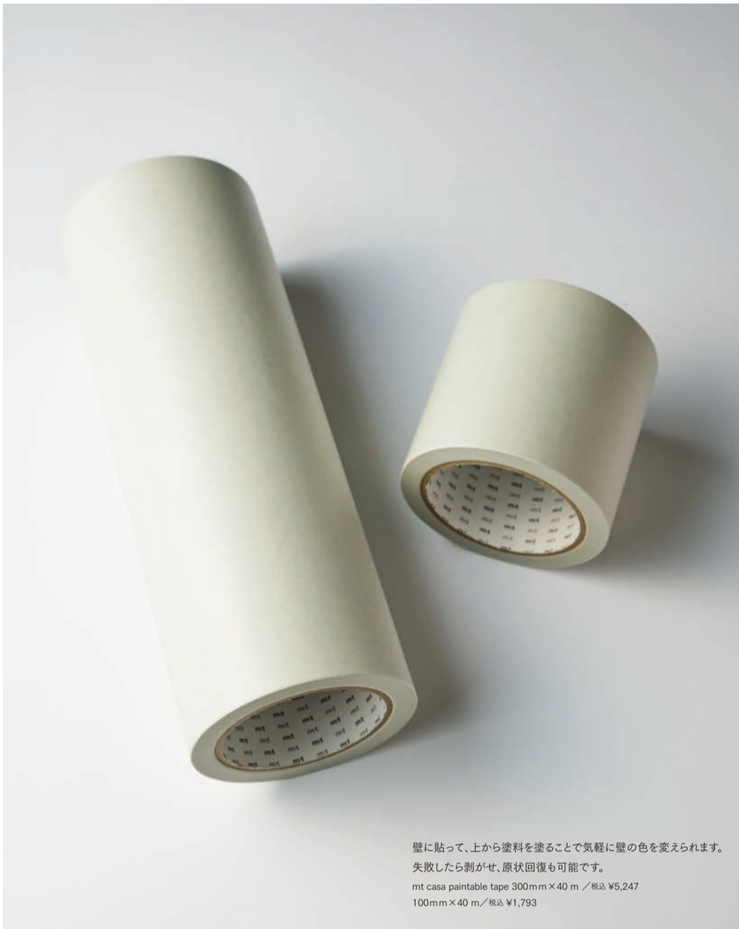
壁に貼って、上から塗料を塗ることで気軽に壁の色を変えられます。 失敗したら剥がせ、原状回復も可能です。 mt casa paintable tape 300mm×40m / 税込 ¥5,247 100mm×40m / 税込 ¥1,793

そしたら、カモ井専務の谷口さんが『できま すよ』と。大きいテープを壁に貼って、その上か らペンキを塗れば壁の色を変えるアイテムとし て使えるのではないかと話が進み、その 後、すぐにサンプルを送ってくださったんです。 うちでいろいろ実験したら、ノリの強さとか、紙 の薄さとか、マスキングテープにもいろんな種 類があるんだなと気づきましたね」