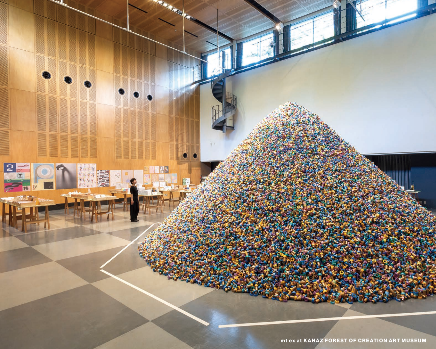
mt ex at KANAZAWA FOREST OF CREATION ART MUSEUM

マスキングテープの廃材を作品に。 作品への興味を喚起することから、 アップサイクルへの関心につなげたい。