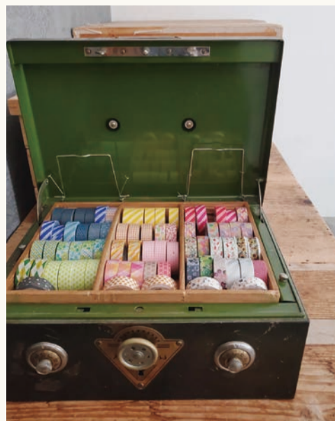
古い金庫に入ったマスキングテープのコレクションから毎日7種類を店頭で用意し、お客さまが好きな色や柄を選べるようにしています。