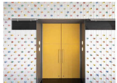
こちらもヘタを使った作品。関心を持ってもらうきっかけになるよう、新鮮な印象を与えるアプローチをしたいと常に考えているそう。

避難所って味気ない場所ですよ。でも、間仕切り用のダンボールにmtが貼られていたり、伝言用のボードにもmtが使われていたりすると知って、心が引き締まる思いにもなりました。せっかく取り組むチャリティーなら、1本でもたくさん売れて現地に貢献できるようなテープをこれからも作り続けていきたいです」